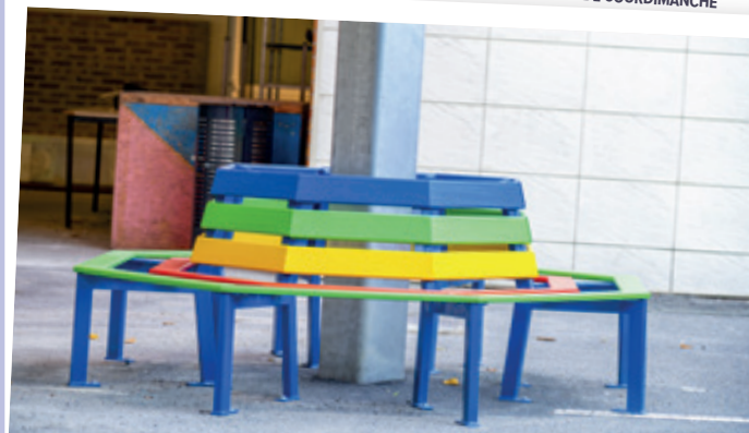
PRÉAU EXTÉRIEUR DE COURDIMANCHE

La sécurité qui constitue un élément important, a été revue à travers le Système de Sécurité Incendie (SSI).