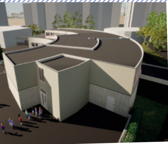
EXTENSION DES AVELINES