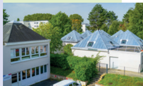
REFECTION DE LA TOITURE DES BERGÈRES

45 000 € d'investissements pour renforcer les dispositifs de sécurité existants : avec la mise en place d'un Plan Particulier de Mise en Sécurité (PPMS) dans les écoles du Barceleau, de la Dimancherie, de la Queue d'oiseau et du Parc.