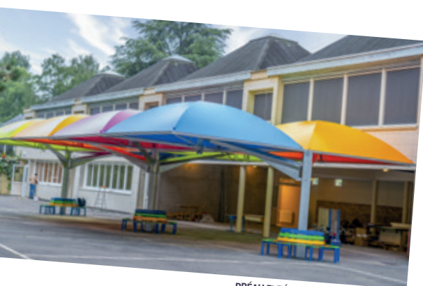
PRÉAU EXTÉRIEUR DE COURDIMANCHE