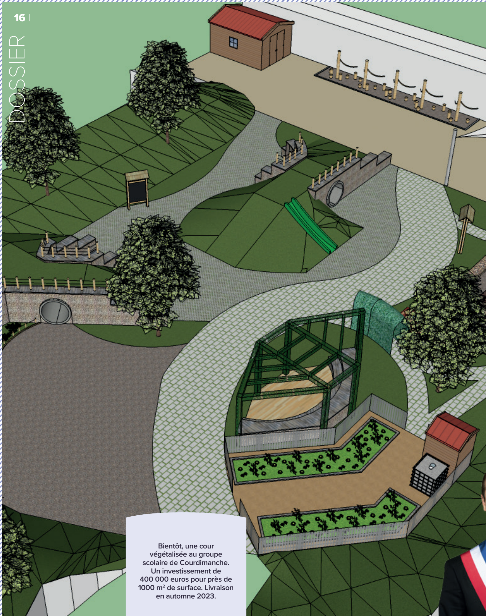
Bientôt, une cour végétalisée au groupe scolaire de Courdimanche. Un investissement de 400 000 euros pour près de 1000 m 2 de surface. Livraison en automne 2023.